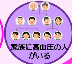
家族に高血圧の人がいる