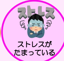
ストレスがたまっている